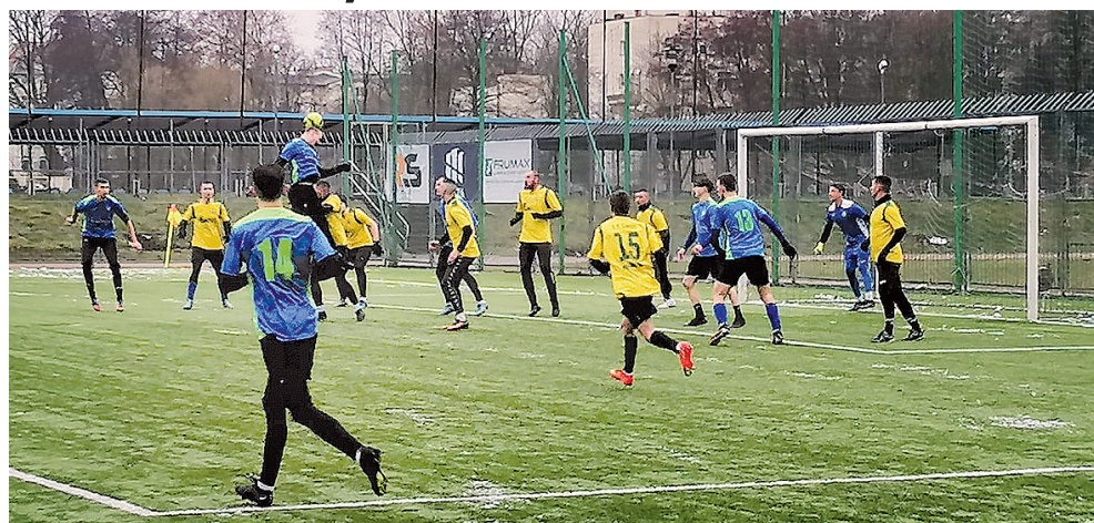
Fragment jednego ze sparingów GKS Manowo

oddaje do końca przebiegu meczu, w którym zespół z Manowa zaprezentował się dużo lepiej niż w poprzednim meczu.