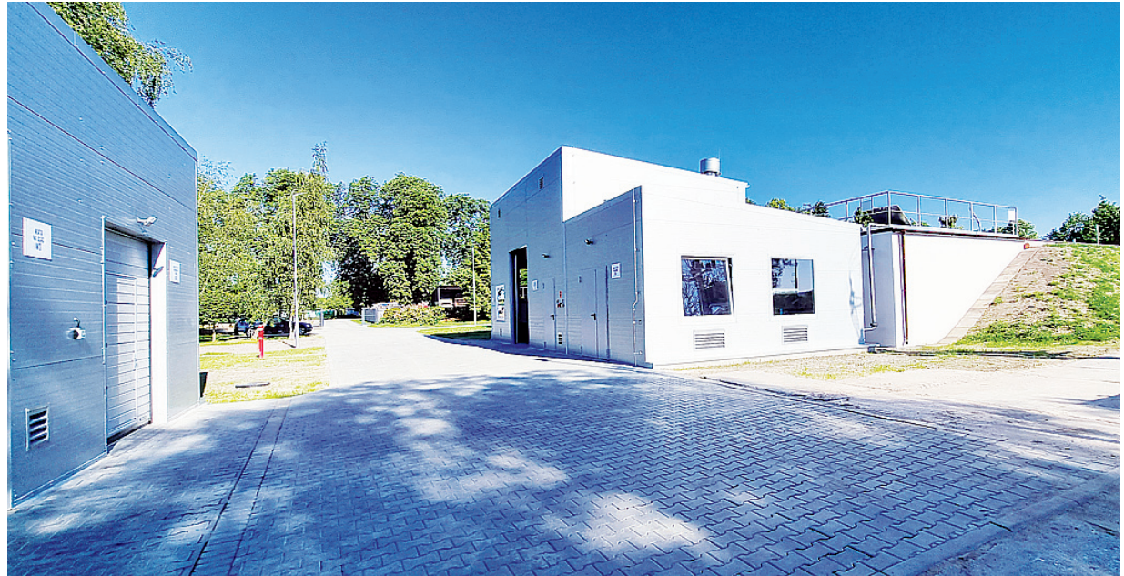
Oczyszczalni ścieków w Boninie