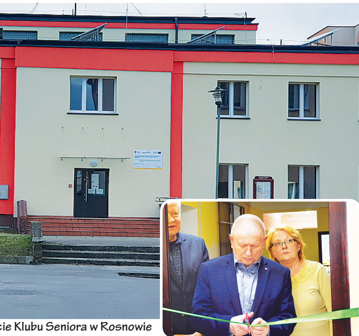
ie Klubu Seniora w Rosnowie

Operacyjnego Województwa Zachodniopomorskiego na lata 2014-2020 działanie 7.6 na prowadzenie zajęć z seniorami oraz zakup wyposażenia i wykonanie podjazdu dla osób niepełnosprawnych do klubu. Dotacja wynosiła 100% wydatków, czyli ok. 338 tys. zł. Pomieszczenia przygotowane w ramach projektu służą obecnie nie tylko seniorom, ale całej społeczności. Najważniejszym efektem zakończonego w 2022 roku projektu jest zawiązanie się grupy seniorów, która nadal aktywnie spędza czas i co ważniejsze stale się rozrasta.